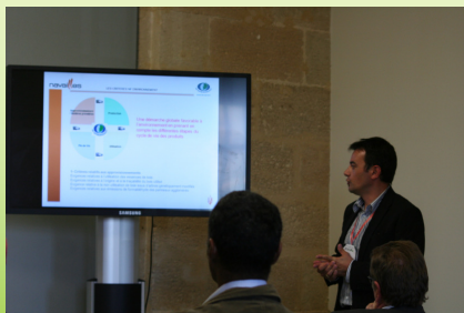
Atelier 2 - Eco-Design : Intégration de l'Environnement dans le Design R. Labasse - Entreprise Navailles (40)